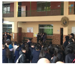
Palabras de la Directora