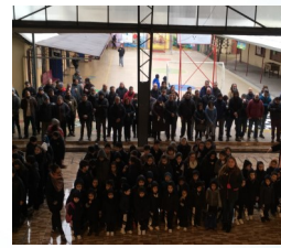
Cursos del Colegio